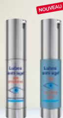
Lubex anti-age® eye intensive ou Lubex anti-age® eye cooling gel