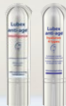
Lubex anti-age® intelligence ou Lubex anti-age® hyaluron 4 types