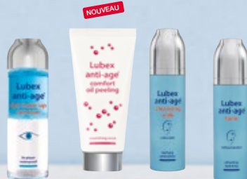
Lubex anti-age® eye make-up remover ou Lubex anti-age® comfort oil peeling ou Lubex anti-age® cleansing milk ou Lubex anti-age® tonic