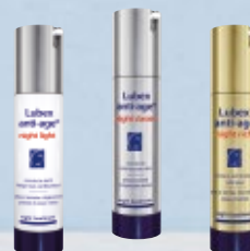
Lubex anti-age® night light ou Lubex anti-age® night classic Hinweis* ou Lubex anti-age® night rich Note*