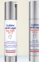
Lubex anti-age® day light SPF30 ou Lubex anti-age® day classic SPF30

+ Treatment complémentaire en cas de besoin, p. 16