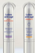
Lubex anti-age® serum multi intensive ou Lubex anti-age® vitamin C