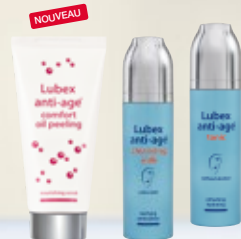
Lubex anti-age® comfort oil peeling ou Lubex anti-age® cleansing milk ou Lubex anti-age® tonic