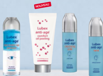
Lubex anti-age® eye make-up remover ou Lubex anti-age® comfort oil peeling ou Lubex anti-age® cleansing milk ou Lubex anti-age® tonic