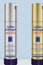
Lubex anti-age® night classic Hirvels* ou Lubex anti-age® night rich Note*