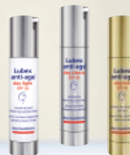
Lubex anti-age® day light SPF30 ou Lubex anti-age® day classic SPF30 ou Lubex anti-age® day rich SPF30

+ Treatment complémentaire en cas de besoin, p. 16