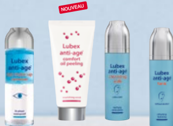
Lubex anti-age® eye make-up remover Lubex anti-age® comfort oil peeling ou Lubex anti-age® cleansing milk ou Lubex anti-age® tonic