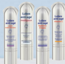
Lubex anti-age® serum multi intensive ou Lubex anti-age® intelligence ou Lubex anti-age® hyaluron 4 types ou Lubex anti-age® vitamin C