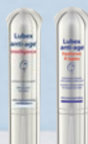
Lubex anti-age® intelligence ou Lubex anti-age® hyaluron 4 types