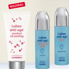
Lubex anti-age® comfort oil peeling ou Lubex anti-age® cleansing milk ou Lubex anti-age® tonic