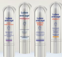
Lubex anti-age® serum multi intensive ou Lubex anti-age® intelligence ou Lubex anti-age® hyaluron 4 types ou Lubex anti-age® vitamin C