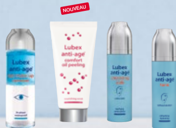
Lubex anti-age® eye make-up remover Lubex anti-age® comfort oil peeling ou Lubex anti-age® cleansing milk ou Lubex anti-age® tonic