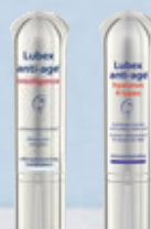
Lubex anti-age® intelligence ou Lubex anti-age® hyaluron 4 types